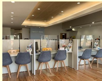
↑広くてきれいな室内です