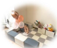
↑キッズスペースもあります☆