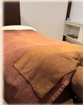
ゆっくりできる 癒しの空間です